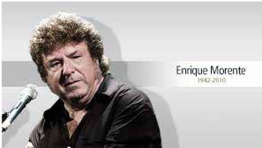
Enrique Morente 1942-2010

La familia, que siempre informó y defendió ante la prensa que Morente ingresó en la clínica La Luz de Madrid por una úlcera de estómago, decidió denunciar al médico por presunta negligencia y solicitó la elaboración de una autopsia.